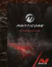
शुरू करना मार्गदर्शिका