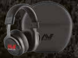
कम अव्यक्ता वायरलेस हेडफोन केरी केस के साथ