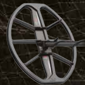
स्कैडिप्लेट के साथ M15 कॉइल 15 " X 12 " अण्डाकार डबल-डी - 5 मीटर (16 फीट) तक वाटरप्रूफ